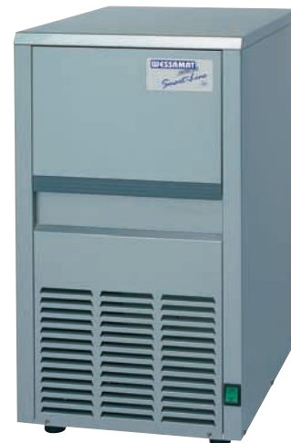
Abb. Modell S 18 L / W

Smart-Line Die preiswerten Eiswürfelbereiter für den kleinen und mittleren Bedarf.