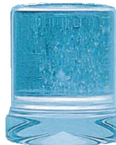
Volleiswürfel Ø 27 x 32 mm · Gewicht 18 g.

Das Eisbereitungssystem der Smart-Line produziert zylindrische Volleiswürfel im Format 27 x 32 mm. Die Eiswürfel sind glasklar und haben eine feste Konsistenz. Mit einer Leistung von 18 kg (ca. 1.000 Stück) bis 58 kg (ca. 3.200 Stück) Eiswürfeln pro Tag bietet diese Produktlinie preiswerte Lösungen für Anwender mit kleinem bis mittlerem Bedarf.